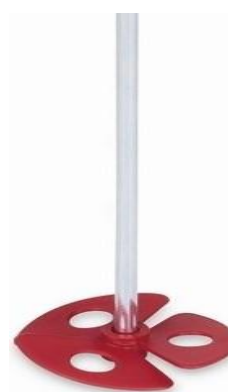
doporučený typ míchadla

Před použitím musí být hmoty vytemperovány na pokojovou teplotu cca 23 °C. Pokud má hmota nebo forma nižší teplotu, systém vytvrzuje pomaleji a hmota nízkou teplotou houstne a má tendenci v sobě jímat bublinky. Nejdříve smíchejte obě složky při normální teplotě v hmotnostním mísícím poměru 100:25. Řádně promíchaná směs se nejdříve nechá cca 15 minut stát, aby došlo k odvzdušnění (pro urychlení je možné vakuování) a poté se odlíje do předem připravené formy či nádoby. Použije-li se forma, která není silikonová, je nutné použít separátor. Důležité je materiál míchat vhodným míchadlem (nejlépe dle nákresu).